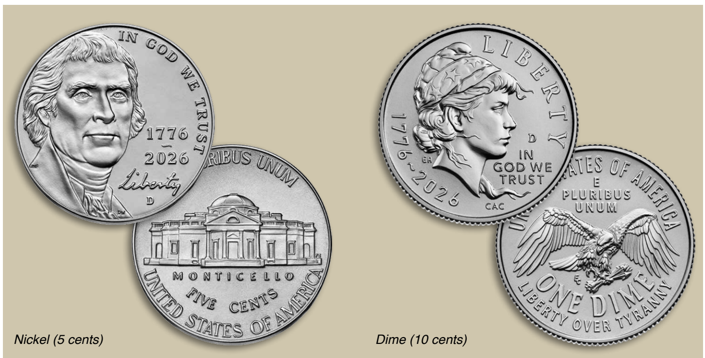
Nickel (5 cents)

Le motif à l'avers du half-dollar (50 cents) présente une vue latérale de la tête de la Statue de la Liberté, son regard tourné vers l'avenir. Au revers, Liberty passe son flambeau à la nouvelle génération. Le revers montre une main tenant une torche tendue vers une autre main, avec en haut l'inscription « Knowledge is the