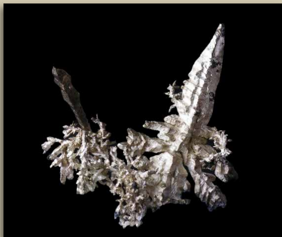
Cristal d'argent natif.

Métal très blanc, capable d'acquérir un haut lustre, de dureté encore peu élevée. L'argent non pur n'est pas très résistant à l'usure, il est le plus souvent allié à du cuivre en plus ou moins grande proportion. L'argent pur est toutefois assez résistant à la corrosion atmosphérique, mais tend à se ternir en se couvrant d'une couche de