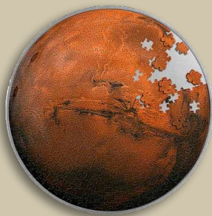
Pièce de 5000 francs CFA, de la République du Tchad, produite en 2023, représentant les armoiries du Tchad sur l'avvers et la planète Mars en casse-tête sur le revers. (1 oz d'argent et 4,5 oz de cuivre).