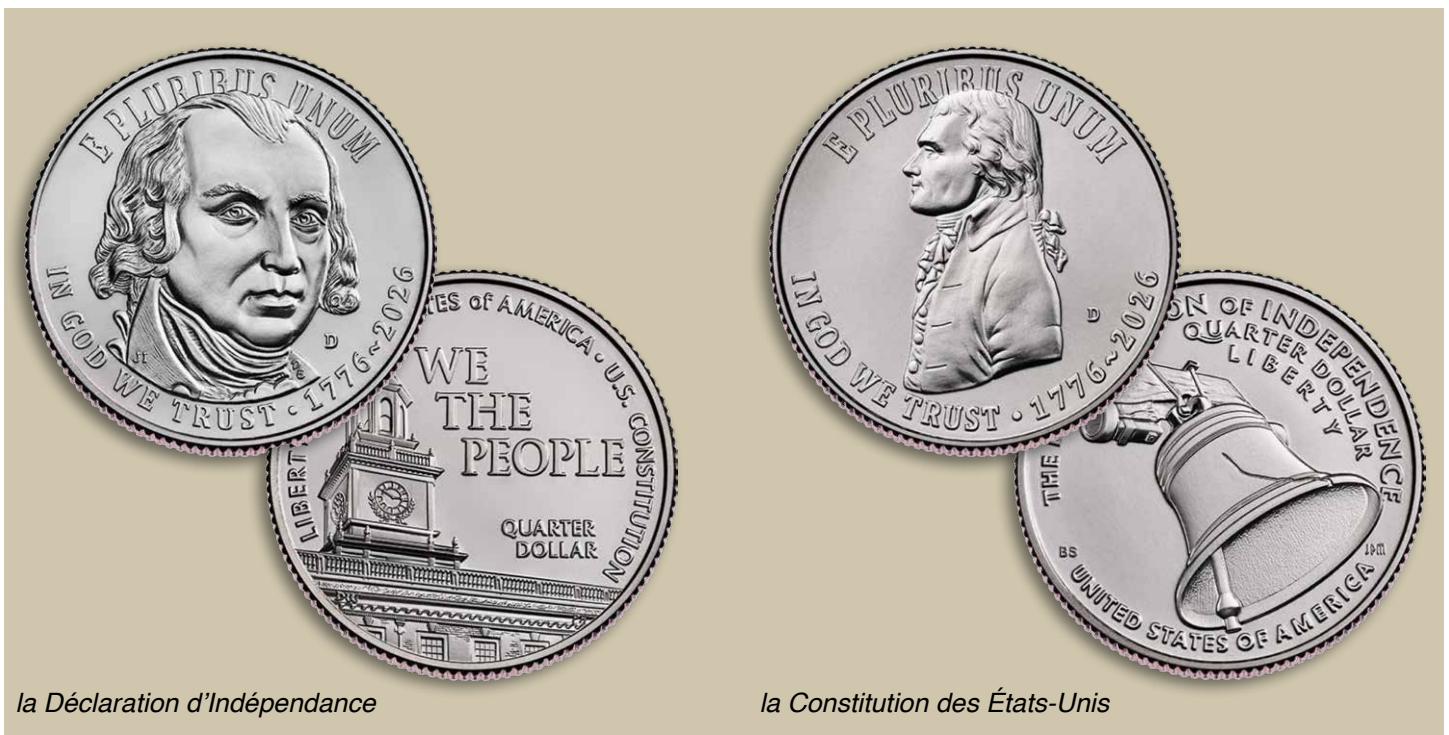
la Déclaration d'Indépendance

Pourrait-il y avoir des failles dans l'armure ? La production de la pièce américaine de 1 cent a été progressivement arrêtée en 2025, ou bien ? Il y a eu beaucoup de publicité autour de ce modeste cent et de sa disparition imminente l'année dernière. Des funérailles sous la forme d'un petit nombre de cents Omega spéciaux vendus aux enchères pour une somme importante ont eu lieu; tout ça en 2025.