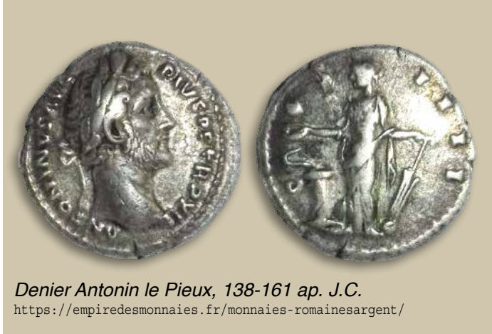
Denier Antonin le Pieux, 138-161 ap. J.C. https://empiredesmonnaies.fr/monnaies-romainesargent/

Il se présente souvent sous la forme de lingots de masses diverses (de 1 once à 1000 onces Troy, ou de 100 grammes à 10 kilos), d'une finesse d'au moins 0.999.