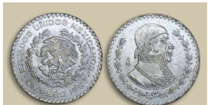
Pièce d'un peso mexicain, daté 1957, contenant 10% d'argent.

Cet alliage était techniquement un « Billon » et contenait en outre 70% de cuivre, 10% de nickel et 10% de zinc. Avec si peu d'argent, on ne peut même plus parler de pièce d'argent, c'est plutôt d'un alliage de cuivre qu'il s'agit.