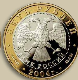
Pièce de 5 roubles russe 2004 : la ville de Rostov. Centre Ag 0.900, anneau : Au 0.900

entre de l'argent 0.500 du 0.800, mais à la limite, avec une certaine marge d'erreur. Toutefois si la pièce a une très basse teneur en argent, le test montrera une trace d'argent faible alors que dans le cas d'une pièce plaquée d'argent, pratiquement aucune trace ne sera visible.