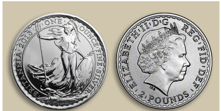
Pièce Britannia en argent 0.958.

L'argent Britannia est à distinguer du métal Britannia, ce dernier est un alliage semblable au pewter et qui ne contient pas d'argent. Il existe d'autres alliages qui sont (ou ont été) utilisés pour faire des pièces de monnaie : argent 0.900, 0.800, 0.500 entre autres.