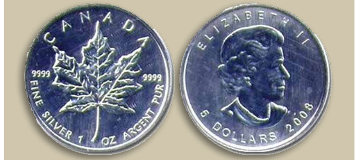
Feuille d'Érable en argent .9999

Même un alliage ayant une teneur de 10% d'argent a été utilisé par le Mexique dans les années '50 et début '60 pour frapper des pièces d'un peso.