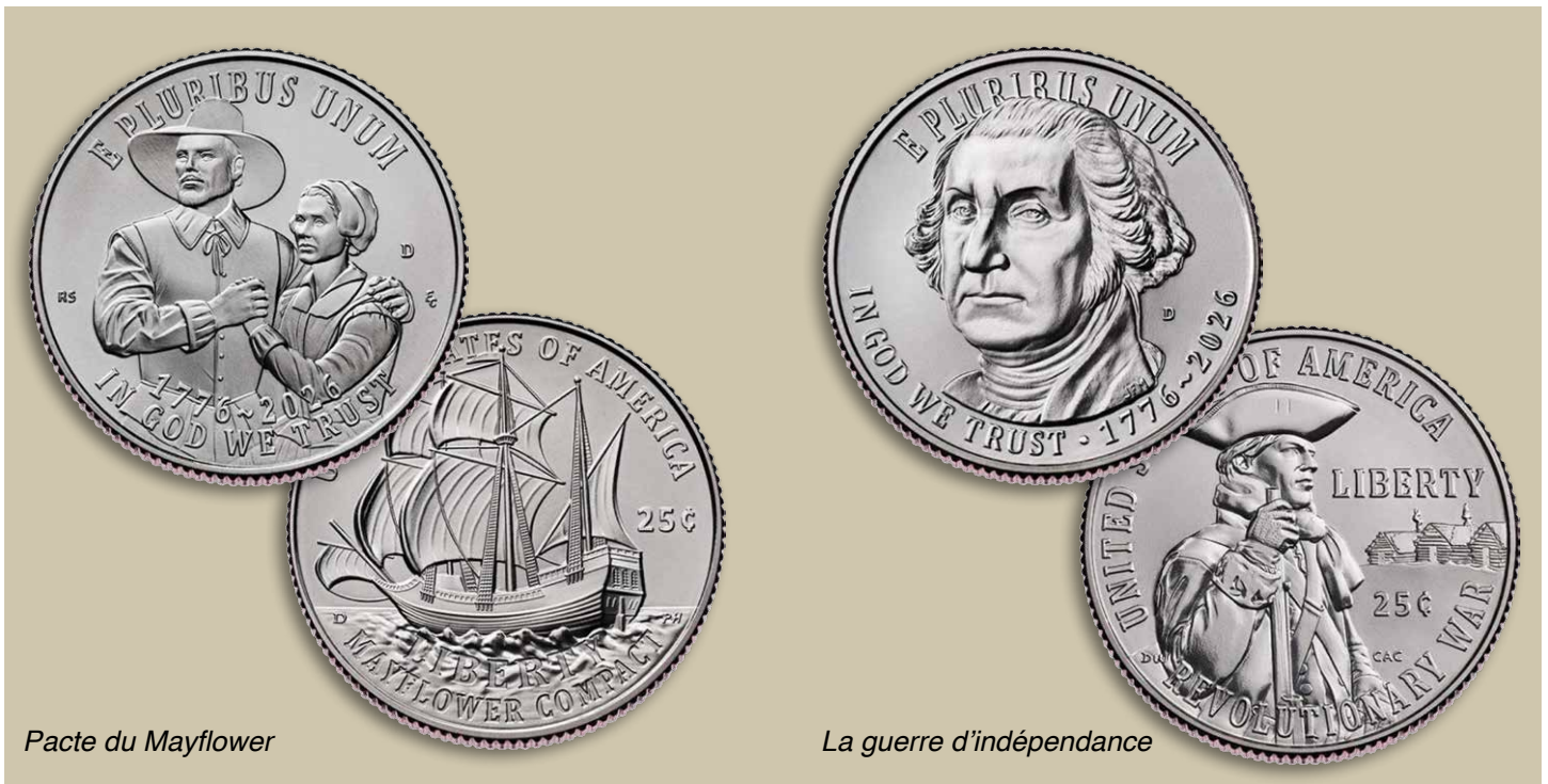
Pacte du Mayflower

Les motifs des pièces ont toujours eu une signification politique. Alors que le débat fait rage autour des quarts de 250e anniversaire de la Monnaie des États-Unis, l'histoire nous rappelle que cette controverse n'est pas nouvelle.