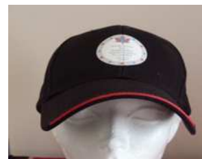
casquette 15 $

La vente de ces items souvenir est l'un de nos rares moyens de financement. Aidez-nous à continuer à produire un bulletin de grande qualité tout en étant fiers d'arborez le logo de l'ANFC.