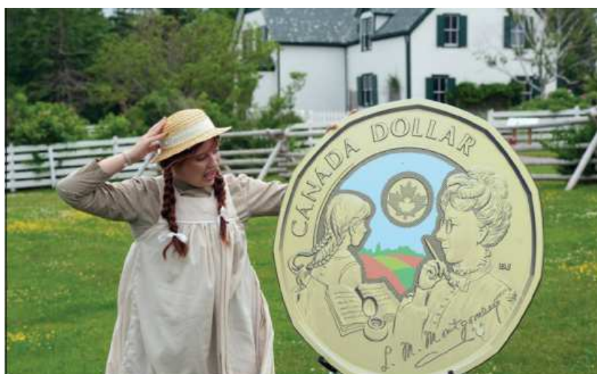
Anne of Green Gables and the circulation coin commemorating author L. M. Montgomery (Cavendish, PEI).

Des pièces de collection s'ajouteront aussi à cette commémoration, sous la forme de rouleaux spéciaux de 25 pièces hors-circulation, offerts en versions colorée et non colorée, et d'une pièce de 20 $ en argent fin.