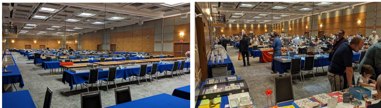
Photos de la Salle des marchands et exposants

Quand y aura-t-il un autre Congrès de ce genre au Québec ?