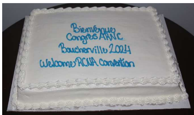
Le gâteau de bienvenue