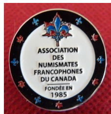
épinglette 5 $