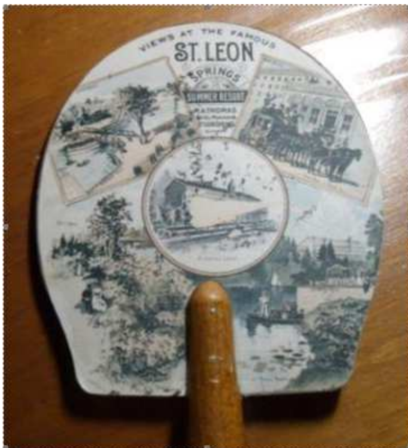
Objet promotionnel de la Source St-Léon

Article de Charles Drisard, publié dans le journal L'Echo de Saint-Justin, le 1 er octobre 1923