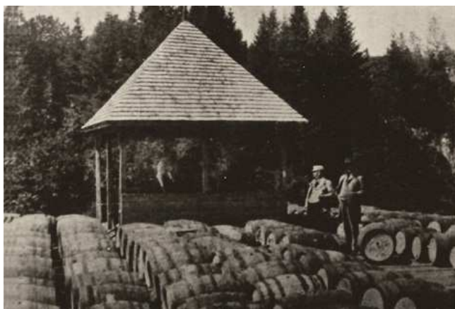
Kiosque où se faisait la mise en barrique de l'eau minérale