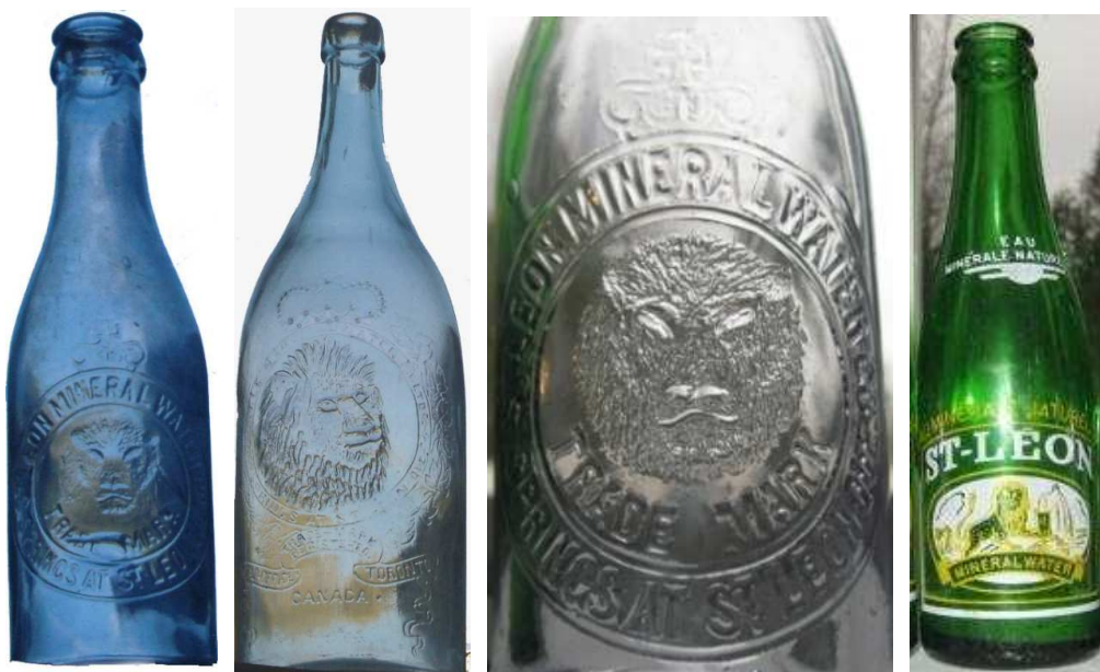
Photos de bouteilles d'eau minérale de St-Léon