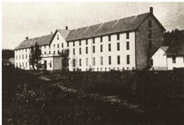
Hôtel Saint-Léon vue de front

C'est lui qui en 1850 fit construire le premier hôtel, une modeste construction comprenant une quinzaine de chambres. Il s'occupa aussi du commerce de l'eau. George Campbell décéda à Québec le 15 octobre 1858, il était alors âgé de 48 ans. En septembre 1871, la veuve Campbell vendit ses intérêts à James K. Gilman, de Derby Line, dans le Vermont. C'est lui qui en 1872 fit construire un nouvel hôtel plus spacieux. Les touristes furent si nombreux que dès 1873 il doubla la capacité de son hôtel qui passa à 154 chambres. Cet hôtel était désigné sous le nom de « St-Léon Spring Hotel » (Hôtel des Sources St-Léon) administré par la St-Léon Spring co. Cet hôtel était très achalandé surtout pendant la saison estivale et il y a eu des années où le nombre de pensionnaires s'éleva jusqu'à 450. C'était le rendez-vous d'une foule d'américains et de l'élite de la société canadienne. Plusieurs personnages ecclésiastiques et politiques y séjournèrent. Et tous les étés, les Abénaquis de St-François venaient y dresser leur tente pour y vendre des paniers et autres objets rustiques.