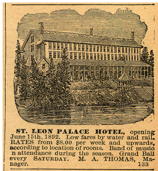
The Gazette, vendredi le 24 juin, 1892

Le premier qui analysa l'eau de St-Léon fut le Dr Thoman Sterry Hunt de Montréal, membre de la Commission Géologique du Canada, formée en 1841. Il fut engagé en 1847 à la Commission, année où il analysa l'eau de St-Léon. Ses travaux furent publiés en 1855 dans « Esquisse Géologique du Canada ».