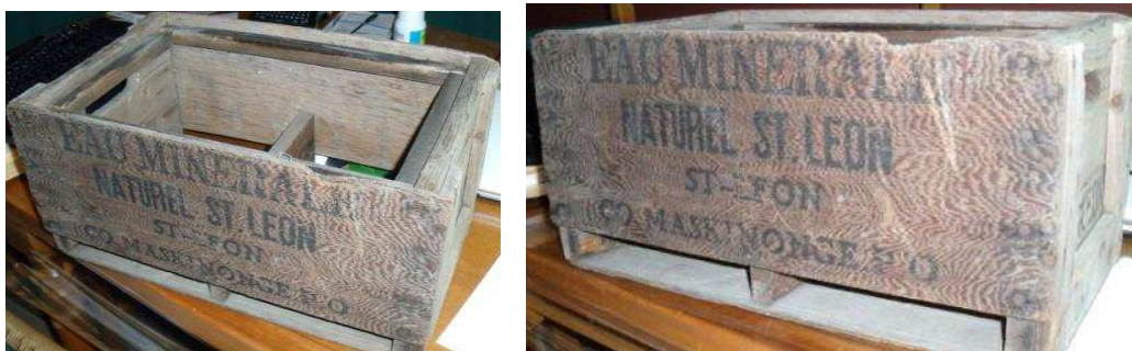
Caisses de bois pour les bouteilles