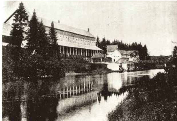
Hôtel Saint-Léon vue de la rivière

Vers 1875 des agents de la province commencent à obtenir le privilège exclusif de distribution de cette eau magique pour leurs régions soit à Montréal, à Trois-Rivières et à Québec. En 1881, une compagnie fut fondée pour faire le commerce de l'eau minérale, sous la raison sociale « The St-Léon Mineral Waters Co. » dont le siège social était à Toronto.