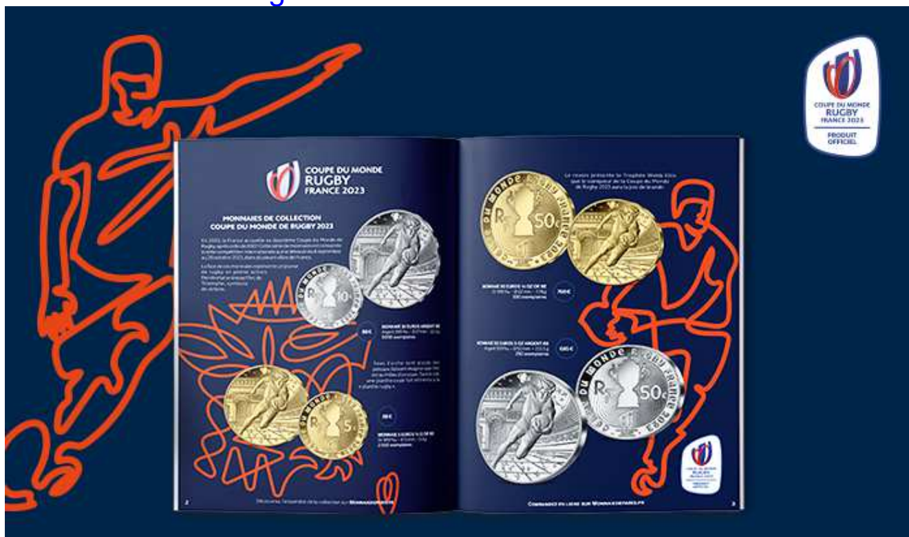
Catalogue Interactif numéro 3 2023 (monnaiedeparis.fr)