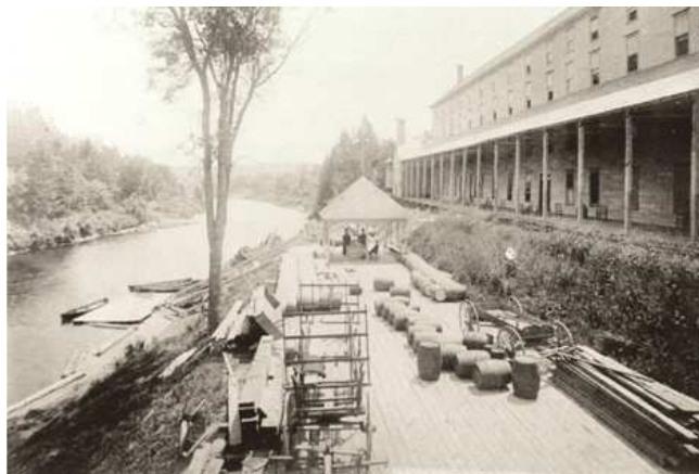
Barriques sur le bord de la rivière du Loup